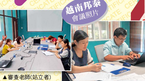
越南邦泰會議照片