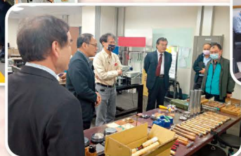
▲勤益校長室意見交流