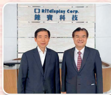
▲本公司董事與葉董事長合影