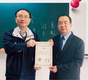
▲12/11受母校機電學院邀請對學弟妹演講分享職涯經驗

人生90%以上的人，都不會找到他們認為好的工作，我們要時時培養學習的熱忱，跟適應工作的能力，才是進入職場應有的態度。將來你們踏出社會，要像海綿一樣，隨時大量吸收新知，成功是給準備好的人。祝福大家，學習快樂！專業成功！