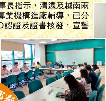
台灣邦泰會議照片