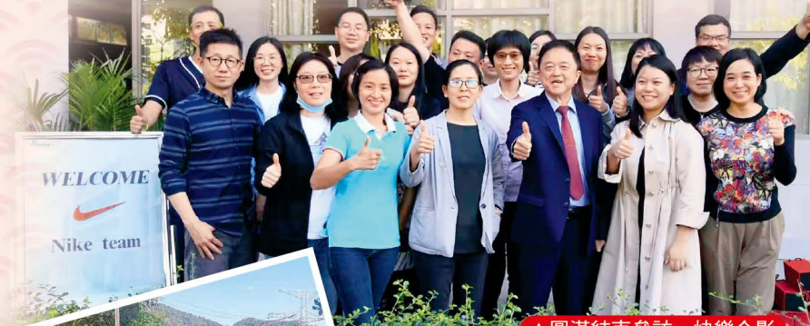
圓滿結束參訪，快樂合影

NIKE一直是邦泰最重要合作夥伴之一，目前仍由清遠邦泰提供多款釘鞋大底與飾片生產服務，清遠廠也在2020年5月完成NIKE工廠認證作業，期盼藉由雙方前後勤部門密切互訪交流，再擴大NIKE更多新的合作商機！