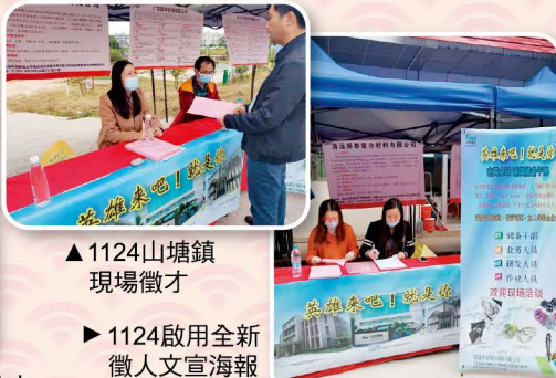
1124山塘鎮現場徵才 1124啟用全新徵才文宣海報