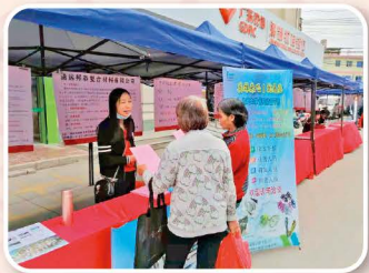
1126龍頸鎮徵才 (當地特殊習慣都由長輩代為至各攤位索取資料)

為體現本土化經營目標，吸納當地優秀人才，我們誠徵包括儲備幹部、業務、研發及生產人員，歡迎各路英雄加入邦泰集團行列！