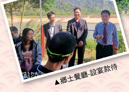
鄉土餐廳-設宴款待