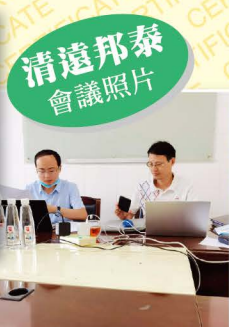
清遠邦泰會議照片