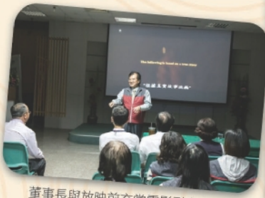
董事長與放映前充當電影引言人