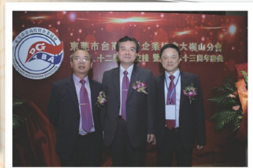
董事長、總經理與曾會長合影