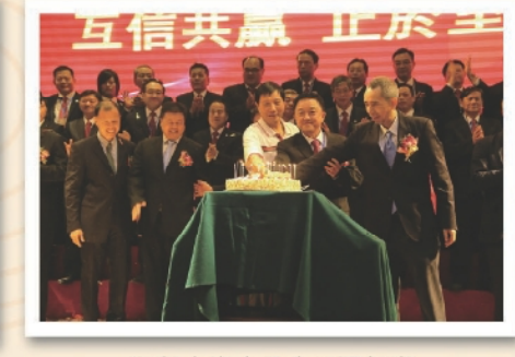
祝賀大嶺山分會23週年慶