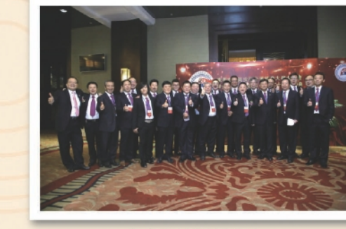
台商會幹部大合照