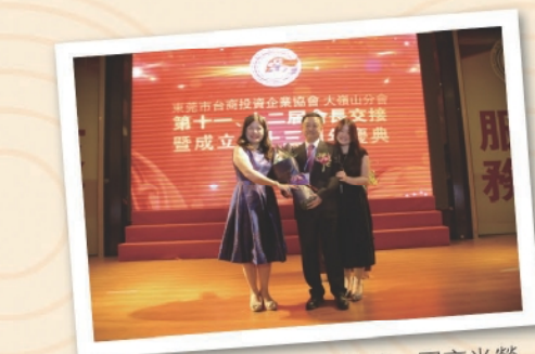
曾總夫人、女兒上台獻花，同享光榮