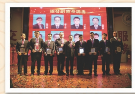
與新聘副會長合影