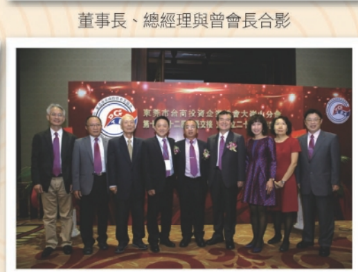
本公司董監事特於董事會前親臨觀禮