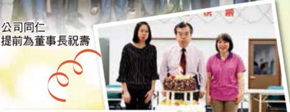
▲公司同仁 提前為董事長祝壽