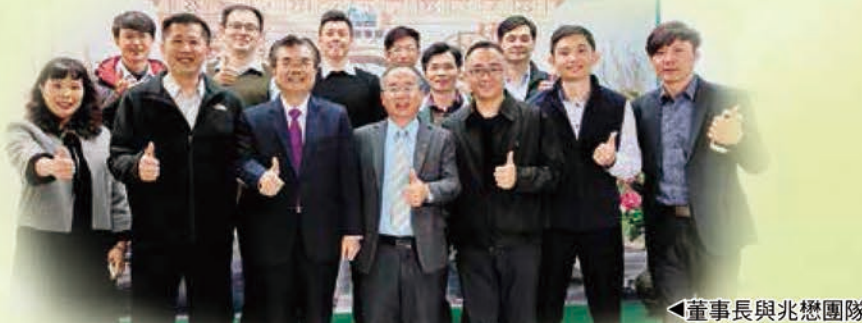
▲ 董事長與兆懋團隊在「金豬旺年」背景前合影