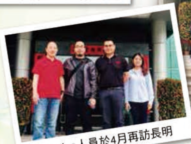
▲Native人員於4月再訪長明