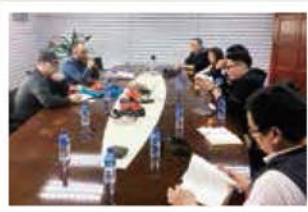
▲Native團隊與長明幹部會議

本公司不斷求新求變，持續努力張開雙手，擴大相關產業廣度與深度合作，為企業可長可久，逐日奠立穩固基石！